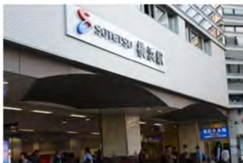
①相模鉄道本線のみなみ西口に出てすぐに交番が見えます。