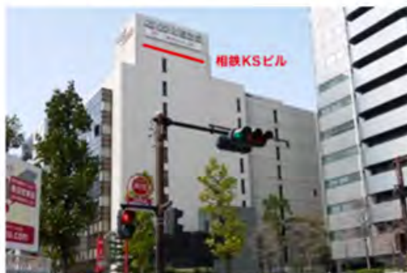
⑧交差点を直進すると、左手に相鉄KSビルが見えます。6階が横浜オフィスです。