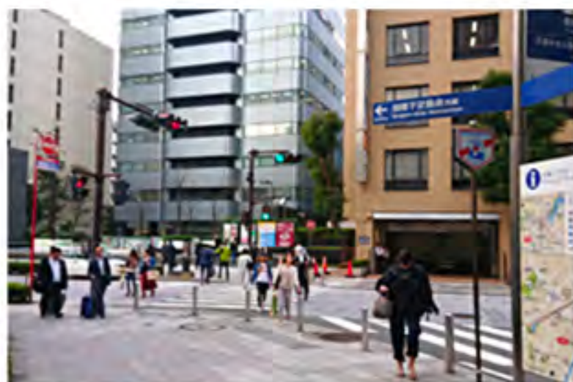
⑦交差点が見えて来るまで、ひたすら直進してください。