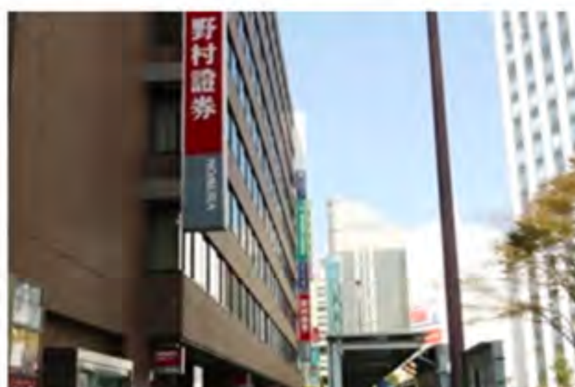
⑥そのまま直進すると、野村證券が見えますので、さらにまっすぐお進みください。