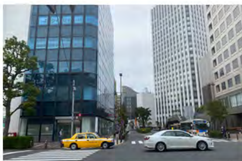
⑤交差点をまっすぐ進み、ガラス貼りのビル方面にお進みください。