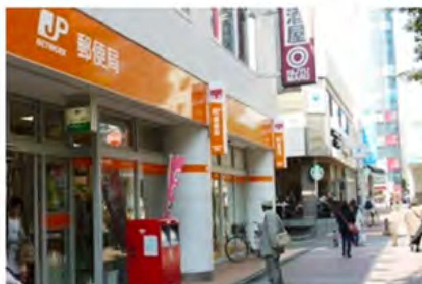
②まっすぐ直進すると左手に郵便局があります。