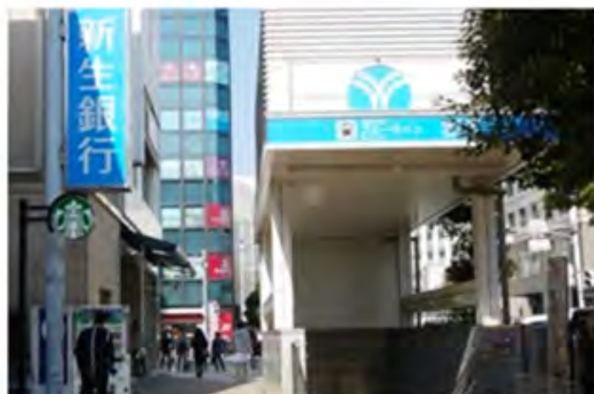
③さらに直進すると、新生銀行と横浜市営地下鉄ブルーラインの地上出口（出口6）が見えます。