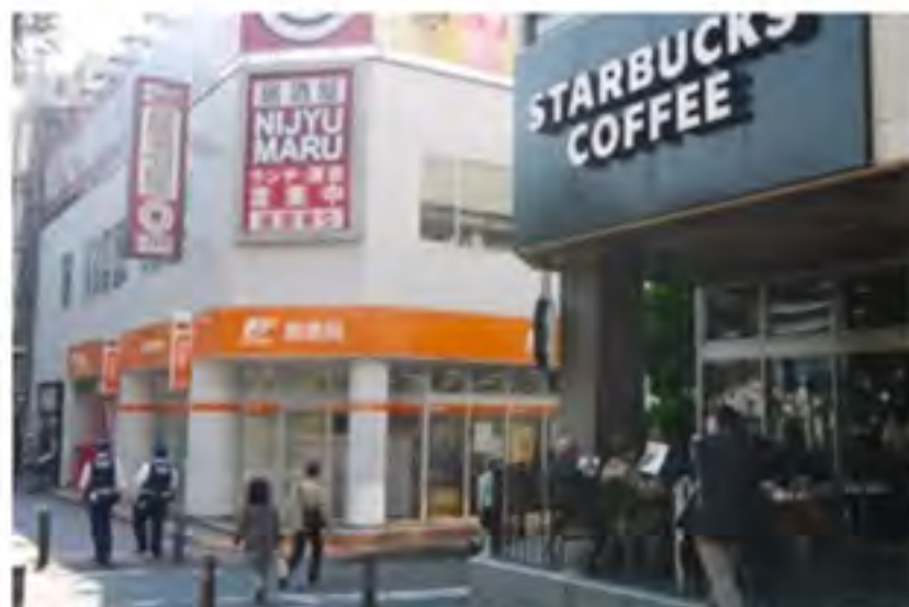
④地下鉄ブルーラインをご利用の方には、出口6に出るとスターバックスコーヒーと郵便局が見えます。その反対側にお進みください。